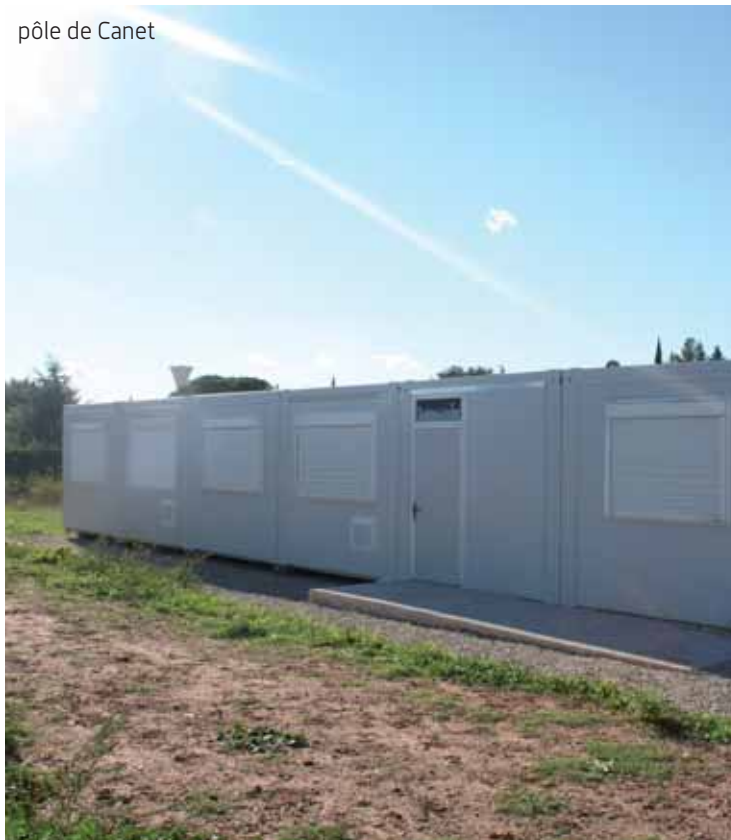
pôle de Canet

Pour les mêmes raisons un bâtiment modulaire provisoire a vu le jour sur le pôle d'accueil de loisirs de Canet. Depuis la rentrée, la section primaire (6 - 11 ans) est relogée dans un bâtiment modulaire provisoire située 105 chemin du pompage. Ce nouveau bâtiment se compose de 3 parties : une salle d'activité, un bloc sanitaire ainsi que le bureau d'accueil.