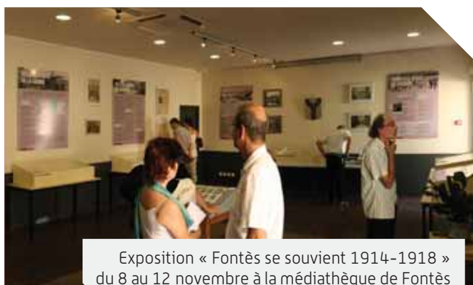
Exposition « Fontès se souvient 1914-1918 » du 8 au 12 novembre à la médiathèque de Fontès