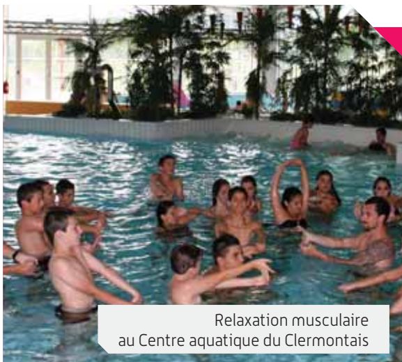
Relaxation musculaire au Centre aquatique du Clermontais

tournoi féminin, accompagné d'un grand weekend sportif et festif, soutenu par la Communauté de communes du Clermontais.