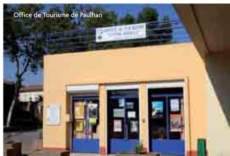
Office de Tourisme de Paulhan

Compte tenu des potentialités touristiques du Clermontais et des projets d'envergure en cours de réflexion pour valoriser ce riche patrimoine et améliorer l'accueil touristique dans différentes communes du Clermontais, le Conseil Communautaire a décidé de remédier à ce déséquilibre et envisage de solliciter prochainement de la part de ses communes le transfert de la compétence tourisme.