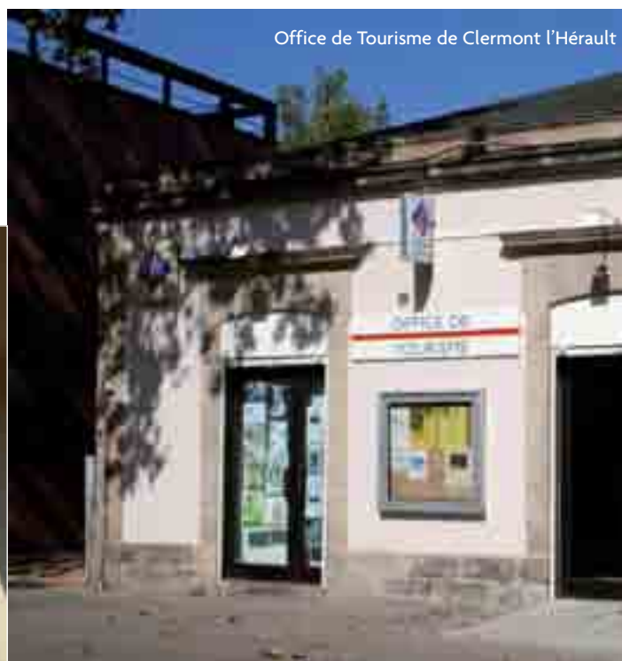
Office de Tourisme de Clermont l'Hérault

Cette étude aboutira sur un rapport de présentation final avec un ensemble de préconisations, qui seront présentées lors d'un Comité de Pilotage courant septembre, afin de permettre aux élus de voter ce transfert dans les meilleures conditions possibles et en toute transparence.