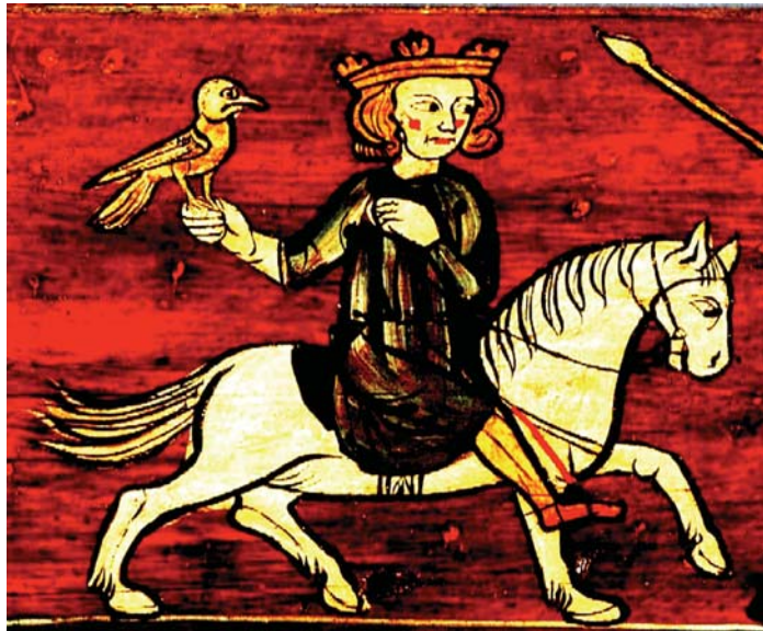
Jacques 1 er d'Aragon