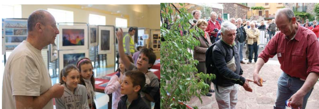
Inauguration de l'Espace Haroun Tazieff en présence de Michel Siffre, Octon 2013