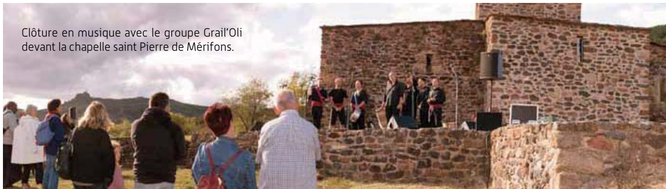
Clôture en musique avec le groupe Grail'Oli devant la chapelle saint Pierre de Mérifons.

La 14 ème édition des Journées Européennes du Patrimoine sur le Clermontais a connu un bilan très positif. Placée sous le thème du "Voyage du patrimoine", elle a mis à l'honneur la richesse du patrimoine de la petite commune de Mérifons. Cette nouvelle édition a également été fortement marquée par la culture occitane. De nombreuses personnes ont participé aux animations proposées par la Communauté de Communes du Clermontais en partenariat avec les associations locales du patrimoine et le théâtre de Clermont l'Hérault. Rendez-vous l'année prochaine.