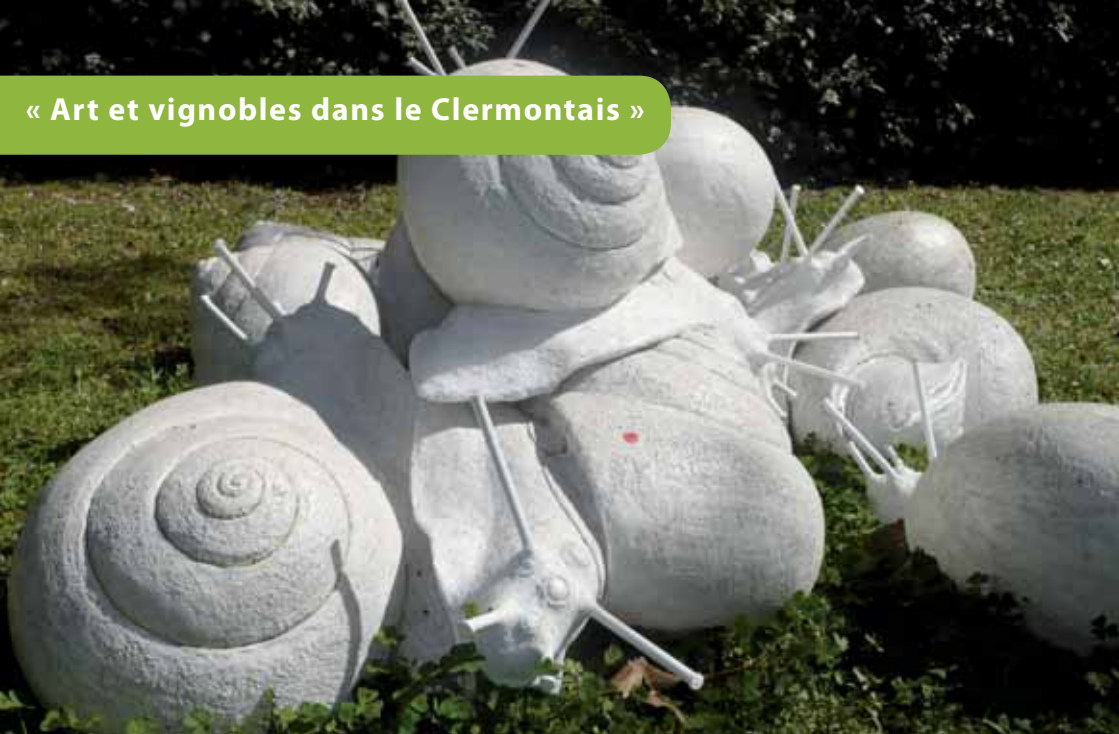
« Le Bonheur est dans le Pré » sculpture au CLAC